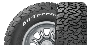
BFGoodrich® All-Terrain T/A® KO2